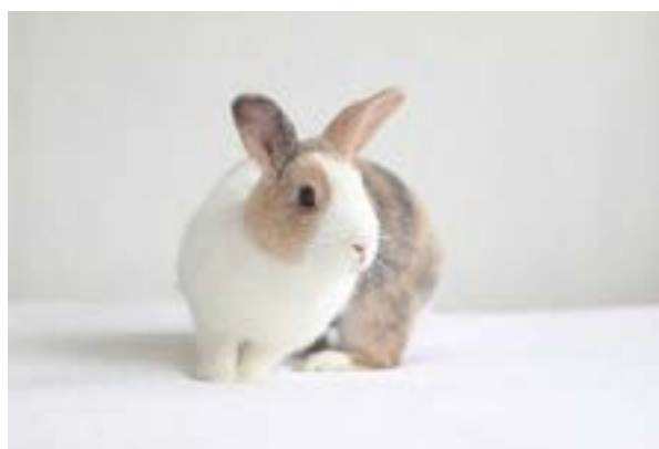
Lumi in oktober 2020