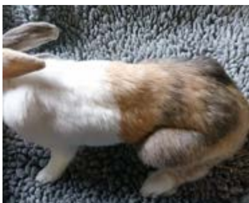
Lumi in juli 2020

Op 1 juli kwam nog een konijn de club versterken. Deze prachtige dame, die de naam Lumi kreeg, was bij binnenkomst niet meer dan een wandelend skelet en extreem verzwakt. Onze vrees dat ze het überhaupt niet zou halen was groot. Gelukkig blijkt Lumi over veel doorzettingsvermogen te beschikken, en dat had ze ook wel nodig want er waren meerdere operatieve ingrepen nodig om haar gezond te krijgen. Helaas moest onder andere Lumi's linkeroog verwijderd worden. Gelukkig redt zij zich heel goed met een oogje minder. Inmiddels gaat het goed met Lumi, hoewel zij wel een zorgenkindje zal blijven. Lumi woont samen met Mars in huis.